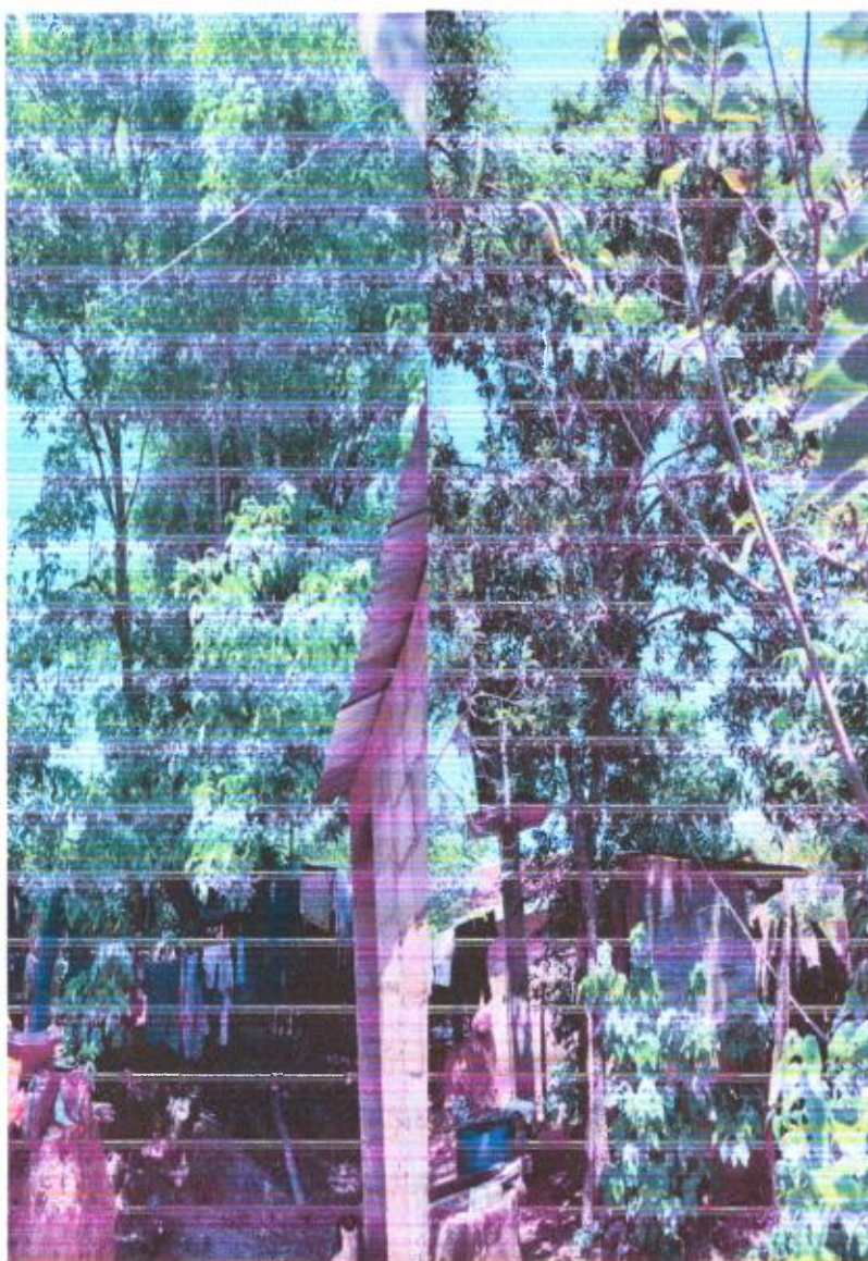
Árbol de Mango