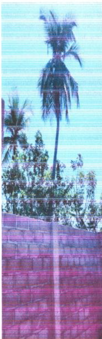
Árbol de Coco

REGISTROS FOTOGRÁFICOS DE LOS ÁRBOLES OBJETO DE LA SOLICITUD: